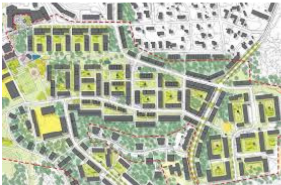
Ett av fem förslag på nya Eriksberg.